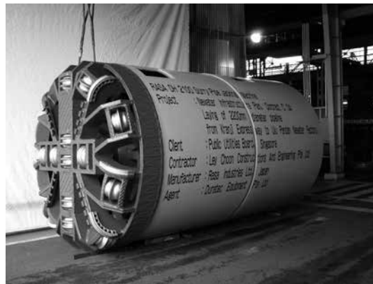
写真-2 岩盤対応型掘進機