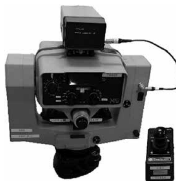
写真-1 ジオジメーター140T(海上誘導用)

20年前の自動追尾測量機には、海上誘導用としてジオジメーター140T(写真-1)があったが大型で高価