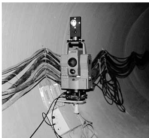
写真-2 上部RMT方式 (自動整準台なし)

ジオジメーター 140T (写真-1) は海上誘導が得意で過酷な現場に適応できる丈夫な作りが特徴で、このジオジメーターシステム S600 も丈夫さを受け継いでおり推進現場でも十分使用可能と判断した。