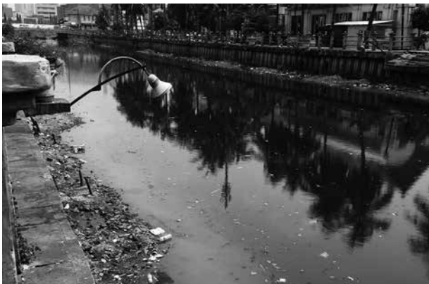
写真-1 発展途上国の河川の状況

そのため、事業対象となる都市は、急速な経済成長と人口増加により、様々な都市問題を抱えている。特に下水処理の分野においては、し尿処理のために腐敗槽などが設置されてはいるものの、汚泥浚渫等の維持管理がきちりとなされていないことや、生活排水の垂れ流しにより、河川や海が著しく汚染され、生活・衛生環境の悪化の原因になっている。実際に事業予定地の視察に訪れた際に河川の状況を見ると、日本の一昔前のドブ川のように変色して濁っており、悪臭が立ち込めていることが多い。そのような状況を目の当たりにすると、下水道の必要性をより一層実感する（写真-1）。また、すでに下水処理場を持っている都市においても下水道事業予算の不足や人員不足により十分な維持管理ができておらず、安定的な電力供給がなされていないなどの問題を抱えている地域も多い。