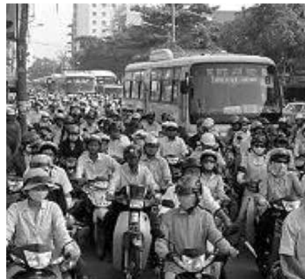
写真-2 ベトナム首都ハノイの渋滞

なお、実施個所によっては、長距離推進技術や急な曲線施工、軟弱地盤への対応など質の高い施工技術