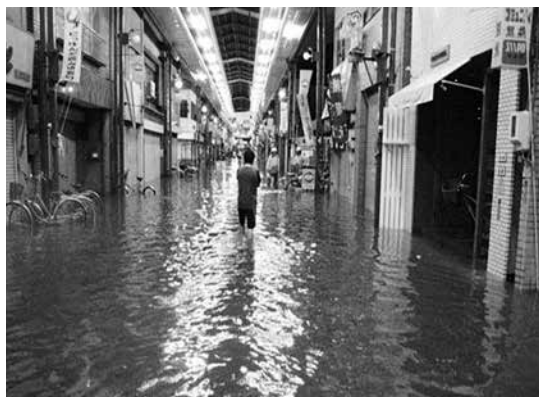
写真-1 平成20年8月末豪雨時の浸水状況(中川運河上流地域)

名古屋駅周辺を含む中川運河上流地域においても、緊急雨水整備事業の一環として、雨水調整池やポンプ