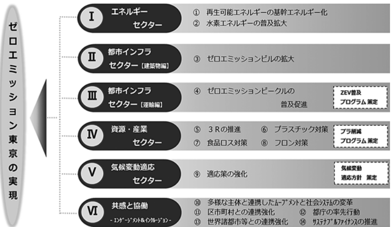
図-2 ゼロエミッション東京戦略の体系

また、重点的対策が必要な分野については、より詳細な取組内容等を記した個別計画・プログラムとして「東京都気候変動適応方針」「プラスチック削減プログラム」「ZEV普及プログラム」を策定し、本戦略と同時に公表しました（図-2、3）。