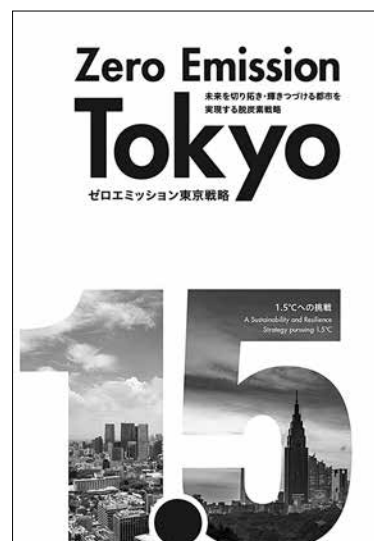
図-1 ゼロエミッション東京戦略