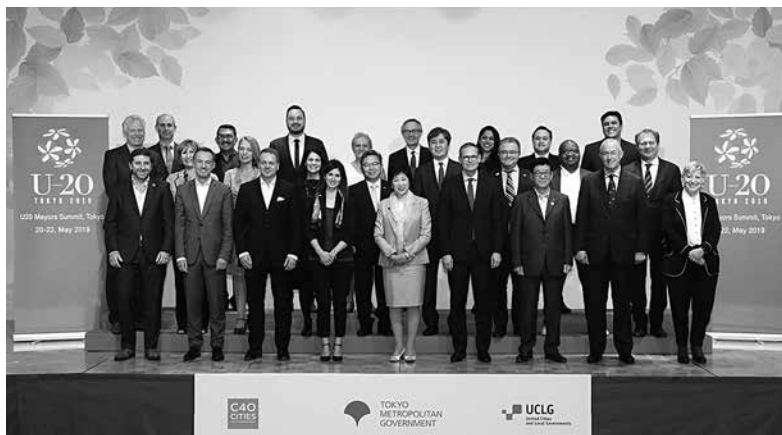
写真-1 U20東京メイヤーズ・サミット

本戦略は、東京の脱炭素化の出発点となるものです。エネルギー、都市インフラ、資源・産業などのあらゆる分野において、低炭素化から脱炭素化へと社会システムを速やかに移行し、世界共通の課題に取り組んでいきます。