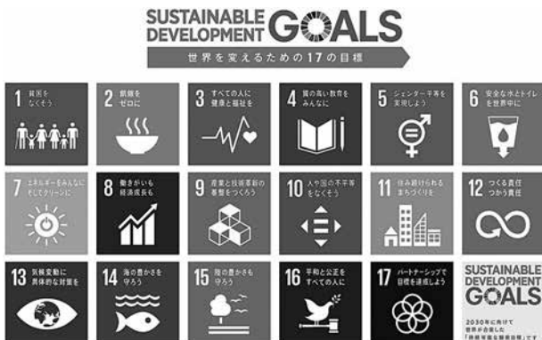
図-1 SDGs 17の目標

このように国際的な環境保全の取り組み機運の高まりの中、日本国および日本企業にもそれらの考え方や目標と連動した取り組みが求められています。