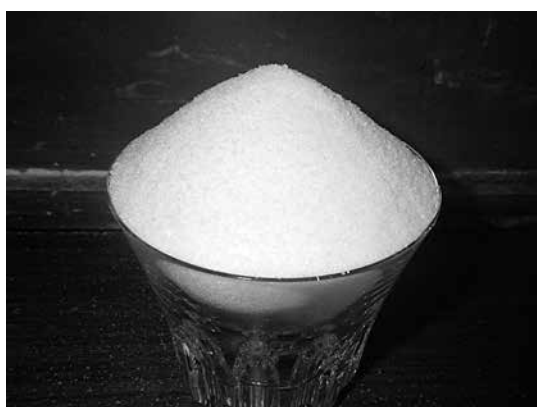
写真-1 アルティー K粉末

なお、アルティー Kの運搬量の低減効果（CO 2 排出量比較）については、「⑤泥水調整剤の軽量化のメリット」で後述します。