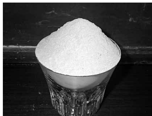
写真-3 マッディー G粉末

マッディー Gは少量の配合で高性能な泥水を作ること为目标とし開発した泥水調整剤です（写真-3）。従来の標準設計配合が粘土・ベントナイト等を多量に使用して泥水の比重1.25程度を確保するのにに対し、マッディー Gは表-2のように、低比重で切羽の保持と流体輸送性等の泥水に求められる必要な流体性能を満足します。