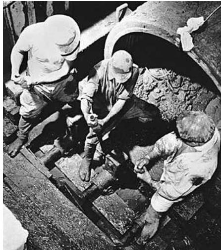
写真-1 初期の施工状況

ちなみに、この工事規模は、口径600mm 鑄鉄管、推進距離6mだ。今日では、呼び径800未満での管内人的作業は法によりすべて禁止されているが、当時では、情熱技術者を取り囲む若き作業員団のなせる業といわざるを得ない（写真-1）。