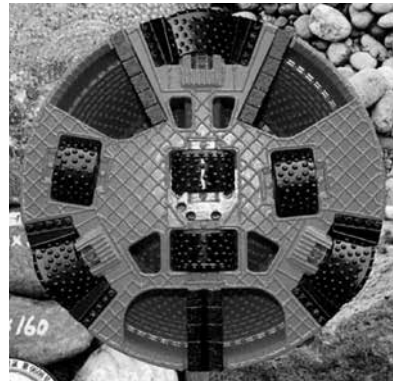
写真-2 カッタヘッド面板（フラット型）