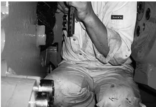
写真-1 呼び径1200岩盤用掘進機でのカッタチャンバ内作業状況