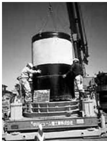
写真-3 刃口、側塊設置 3)