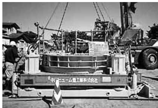
写真-2 圧入機据付設置 3)